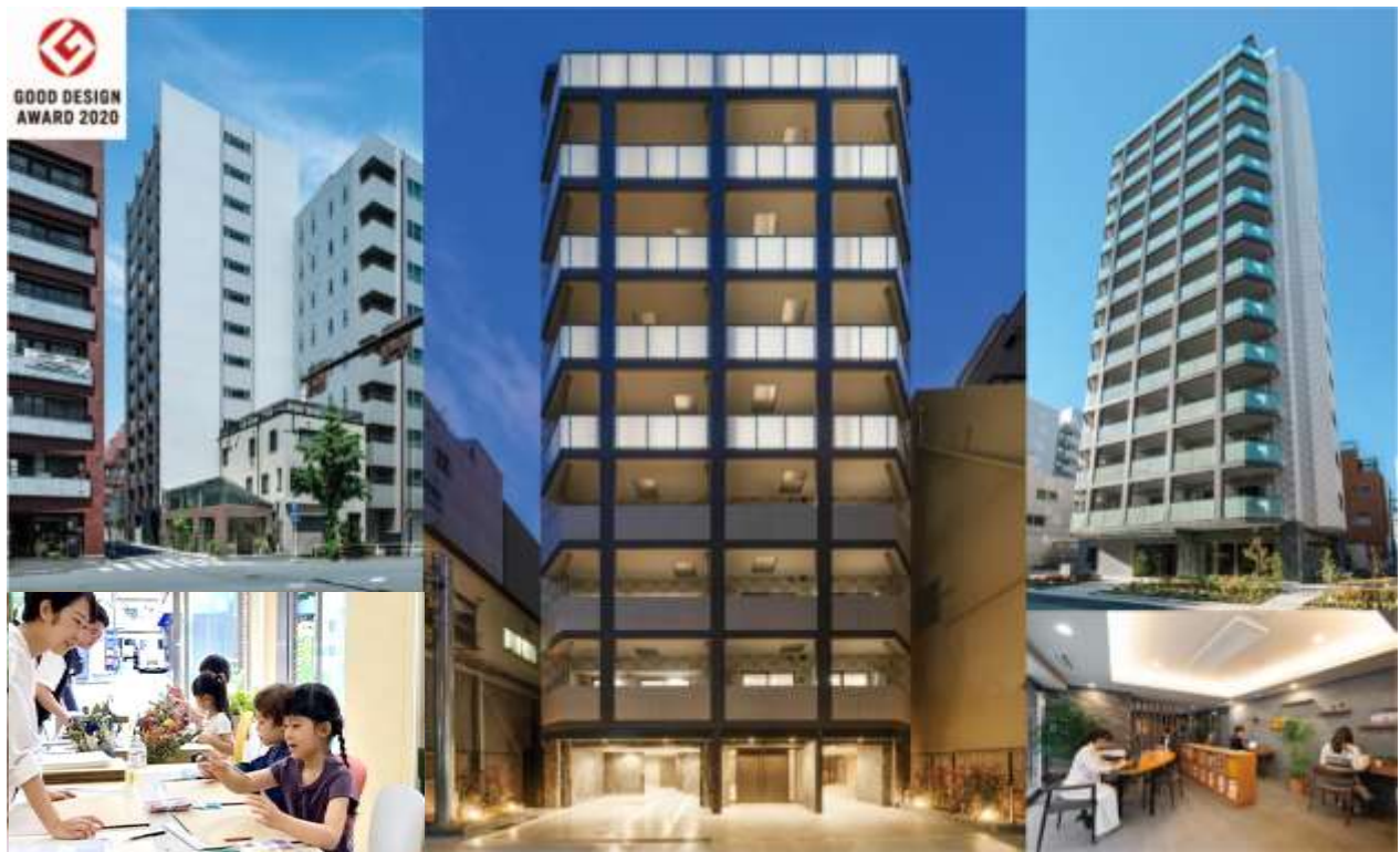
レクシード秋葉原