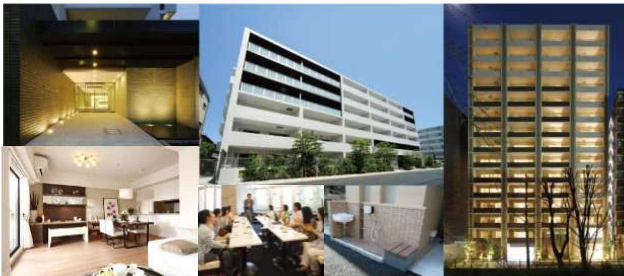
左上 レアシス国立大学通り・中央上 レアシス港北ブライトプレイス・右 レアシス新横浜パークフロント・

大手企業との共同事業も行っており、リビオ綱島イーストコートは、日鉄興和不動産と当社との共同プロジェクト、フェアシス八王子新町は、当社と相鉄不動産株式会社との共同事業であり、いずれも好評を持って迎えられ、分譲完了しております。