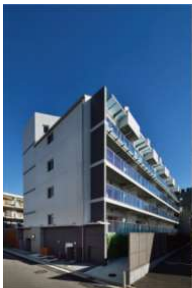
リビオ綱島イーストコート