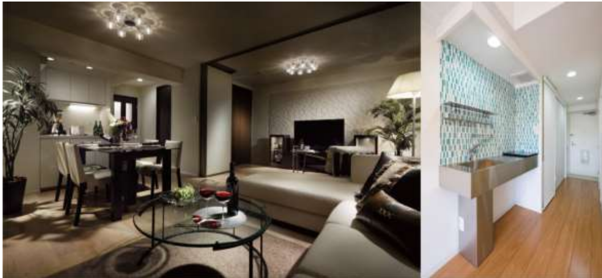
リモアにより生まれ変わった物件

好立地にある築年数の経過したマンションを、壊すのではなく生き返らせ（RE）、顧客仕様の理想の住まいへとより近づけること（MORE）をコンセプトにしたもので、「リモア」は当社の登録商標であります。老朽化した居住用不動産を、新築時の状態に戻すうわべだけの補修（リフォーム）とは違い、当社デザイナーが建物外観や室内の改装を行い、また、建築士の指示による水道・配管・電気系統等の設備、壁面・屋上等の建築・防水状態やセキュリティー等に関して、必要に応じて補修工事を行うなど、品質面での価値を付加しております。このように住む人のニーズにマッチした根本的な改修を施すことで、新築時を超える機能や性能の向上のみならず、建築物に先進的な設備や高い省エネ性など新たな価値を提供しております。