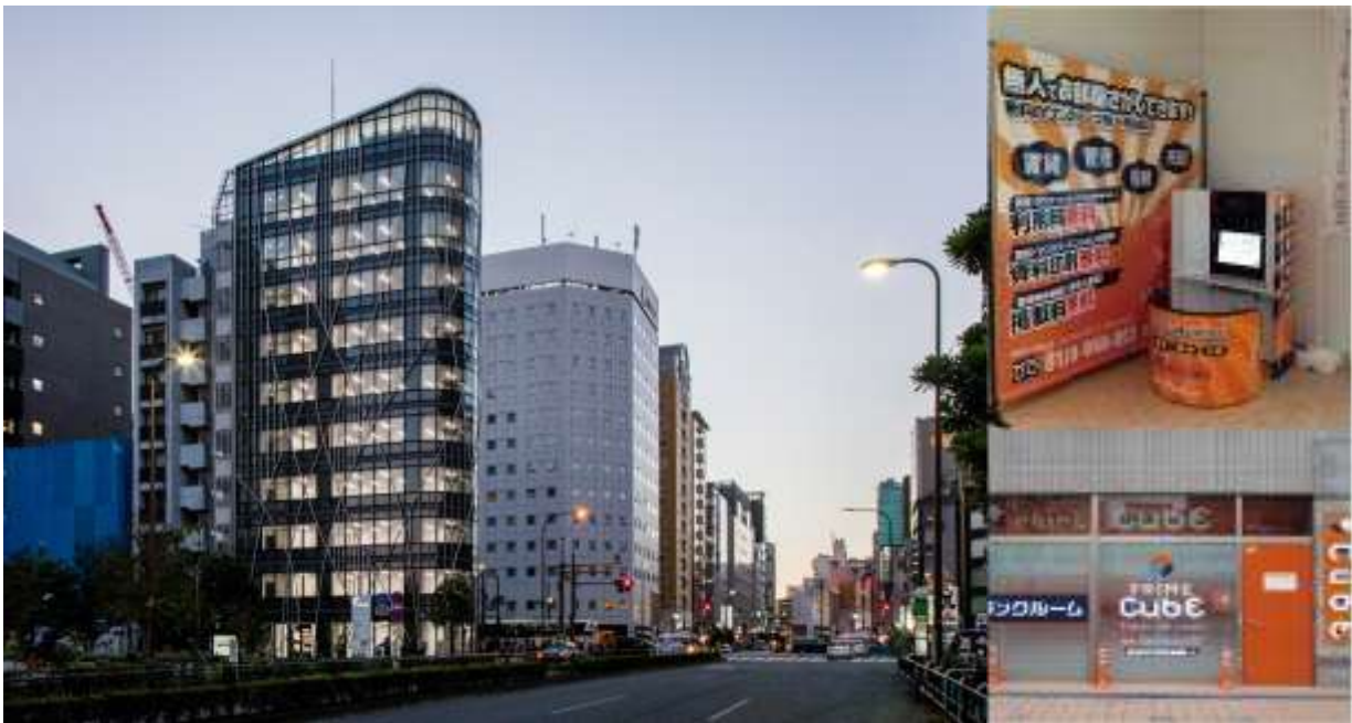
新宿イーストクロスタワー

スタッフレスショップでの賃貸相談窓口設置、VRによる内見やスマートフォンアプリを利用した内見予約システムの導入などIT技術の活用による賃貸管理の業務効率向上に取り組んでおります。