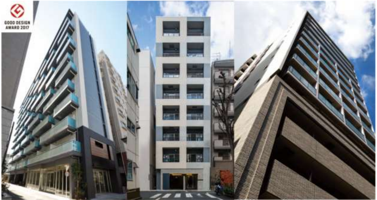
レクシード両国駅前