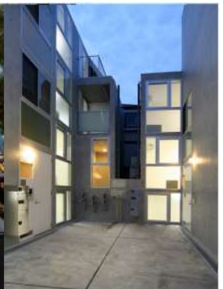
レビュー三軒茶屋レジデンス