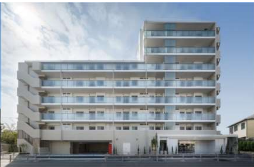
フェアシス八王子新町