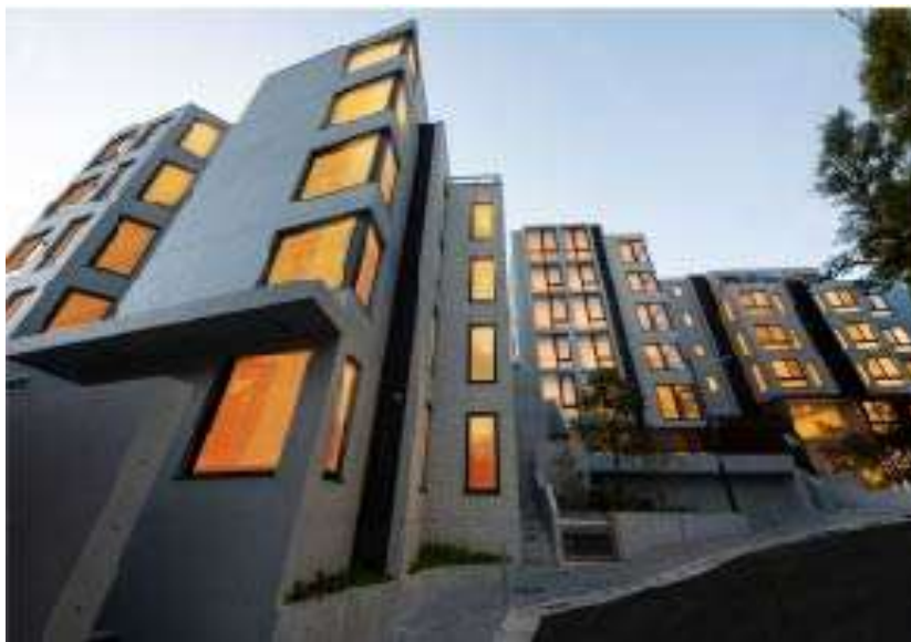
レクシード品川大井町テラス棟・フォレスト棟