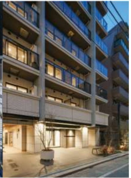
レクシード神楽坂