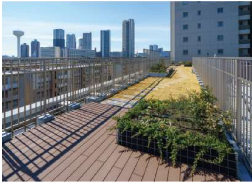
TATSUMIスカイガーデンテラス（屋上テラス）