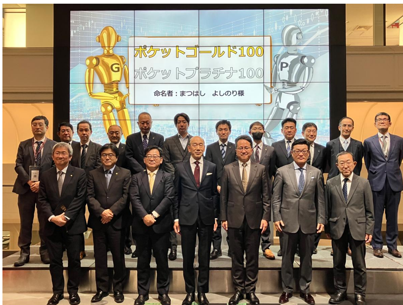
＜金及び白金先物の新商品愛称発表式＞