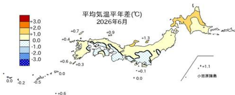
平均気温平年差、降水量平年比、日照時間平年比の分布

6月の平均気温は、北日本が高めに推移したが、東日本と西日本は平年並みだった。ただ、前年が厳しい暑さだったため、前年比では大幅に低くなる地域が多かった。降水量は、低気圧や梅雨前線、上旬と下旬に日本付近を通過した台風6号、7号、8号の影響により、全国的に多めとなった。このため、渇水だった地域も解消されるところが多くなった。日照時間は、移動性高気圧に覆われやすかった北日本の日本海側でかなり多かったが、東日本から西日本の太平洋側では少なかった。