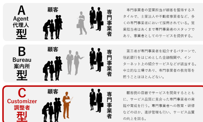
<相続サービスに関する顧客接点 (媒介者) の変化>

A型、B型についてはそれぞれ「顧客側に立つ媒介者が不在」であり、これらは媒介者の不在によって顧客の相続手続きにおける不安・負担が重いのが現状です。当社のサービスはこの不安・負担を軽減することが大きな特徴です。「顧客側に立つ」ということはどの事業においても言われることですが、当社は実際にサービスとして落とし込むためには、事業モデルを顧客 (カスタマー) にとって望ましい形に変えていく (カスタマイズ) という発想にたどりつき、A型・B型から進化したC型 (Customize=調整型) という独自の概念を創りました。併せてC型を実現するためには、A型である土業事務所の立場ではできないという考えに至り、土業事務所から独立した株式会社組織として当社を設立したというのが創業経緯となっております。