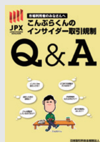
こんぶらくんの インサイダー取引規制 Q&A

また、日本取引所グループ(JPX)のwebサイトではインサイダー取引FAQや啓発ポスターなど、啓発に役立つコンテンツ(無料)も用意しています。